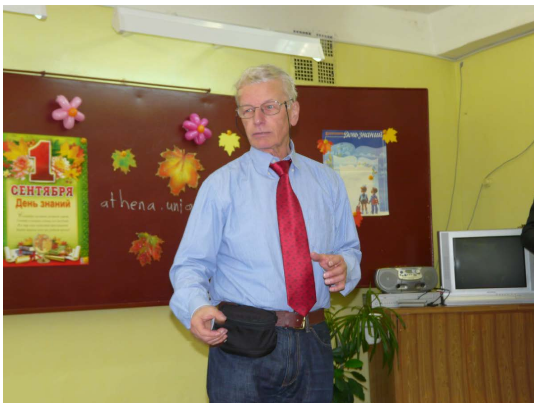
Визит в одну из школ Нижней Туры, чтобы рассказать учащимся о Женевском университете, ресурсах сайта athena.unige.ch , письме посла Швейцарии о совершенстве исследований в России и Швейцарии, о фрибургских сырах и пр..