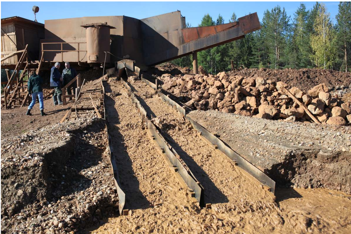
Работа старателей (Au, Pt, Ir, Os и т.д.) на Исе. Землю привозят грузовиками из карстовых участков, где была обнаружена Pt.