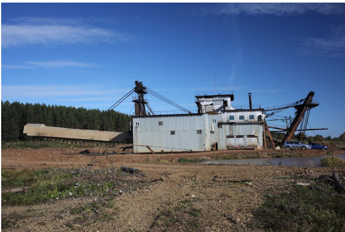
Драга в работе (Au, Pt, Ir, Os и т.д.) на Исе.