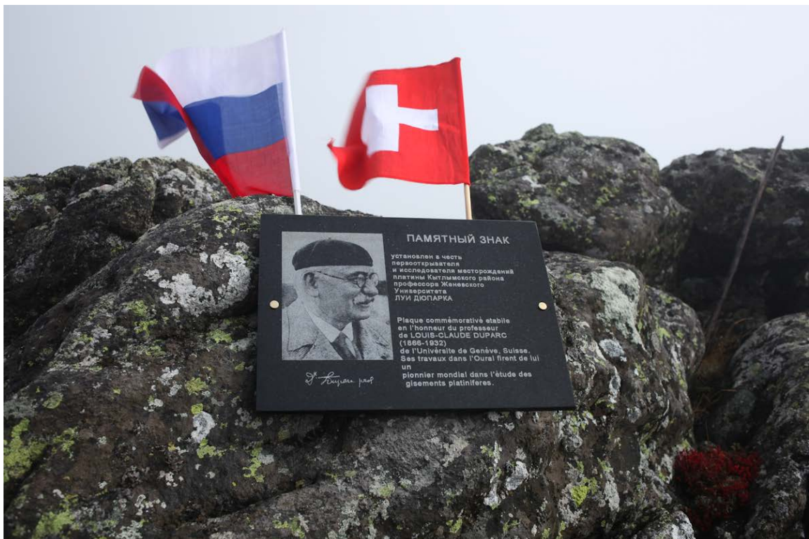
Дюпарков Камень, 5 сентября 2014. Мемориальная доска из диорита в честь Луи Дюпарка.