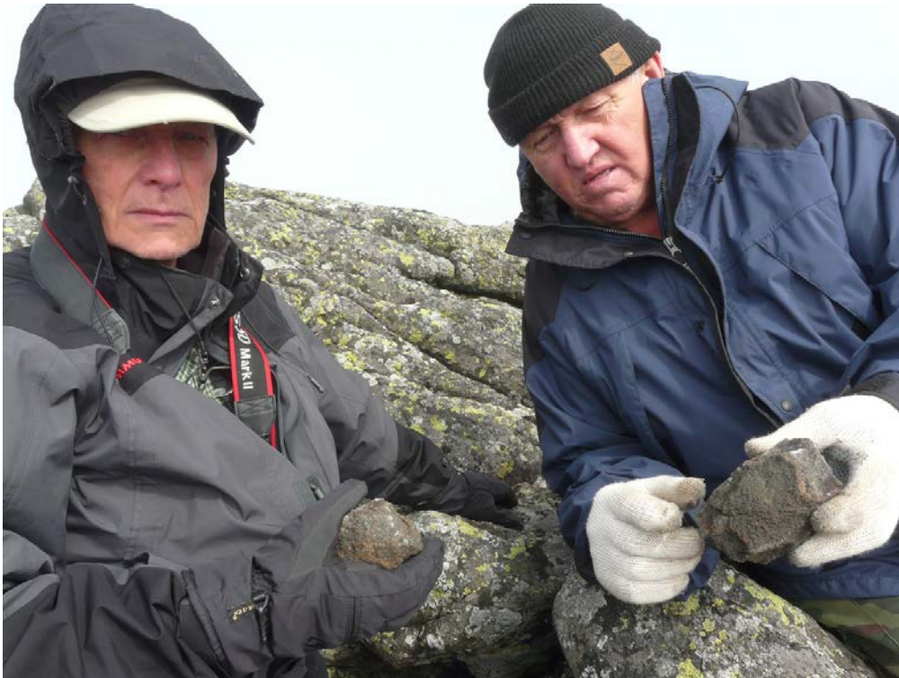
Дюпарков Камень. Пироксенит и титаномагнетит с вершины, поделённые между Исовским геологоразведочным техникумом (ИГРТ) и Женевским музеем естественной истории (MHNG).