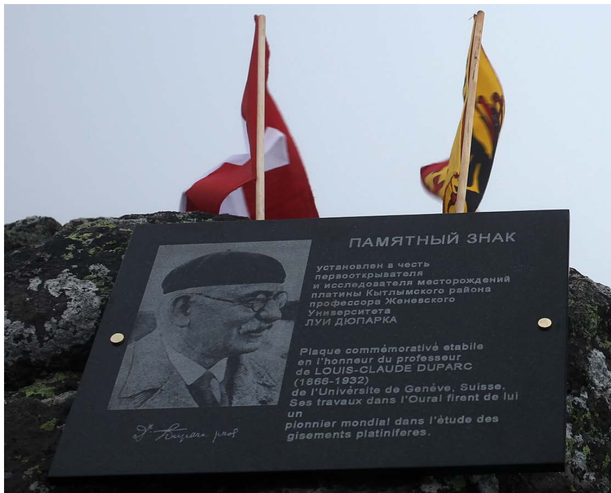
Памятник открыт 5 сентября 2014 г. на вершине 1311 Конжаковского массива.

сентябрь 2014 г. Перевод: Karine Perroud