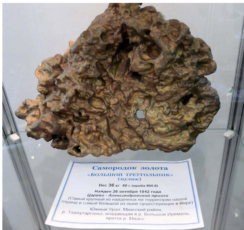
Екатеринбург. Золотой самородок весом 36 кг с Ташкутарганки (Миасс). Сокровищница музея ИГГУ.