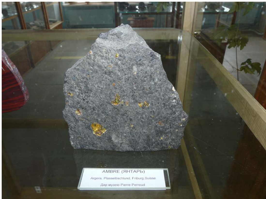
Янтарь. Ärgera, Plasselschlund, Fribourg, Suisse. Дар Pierre Perroud.