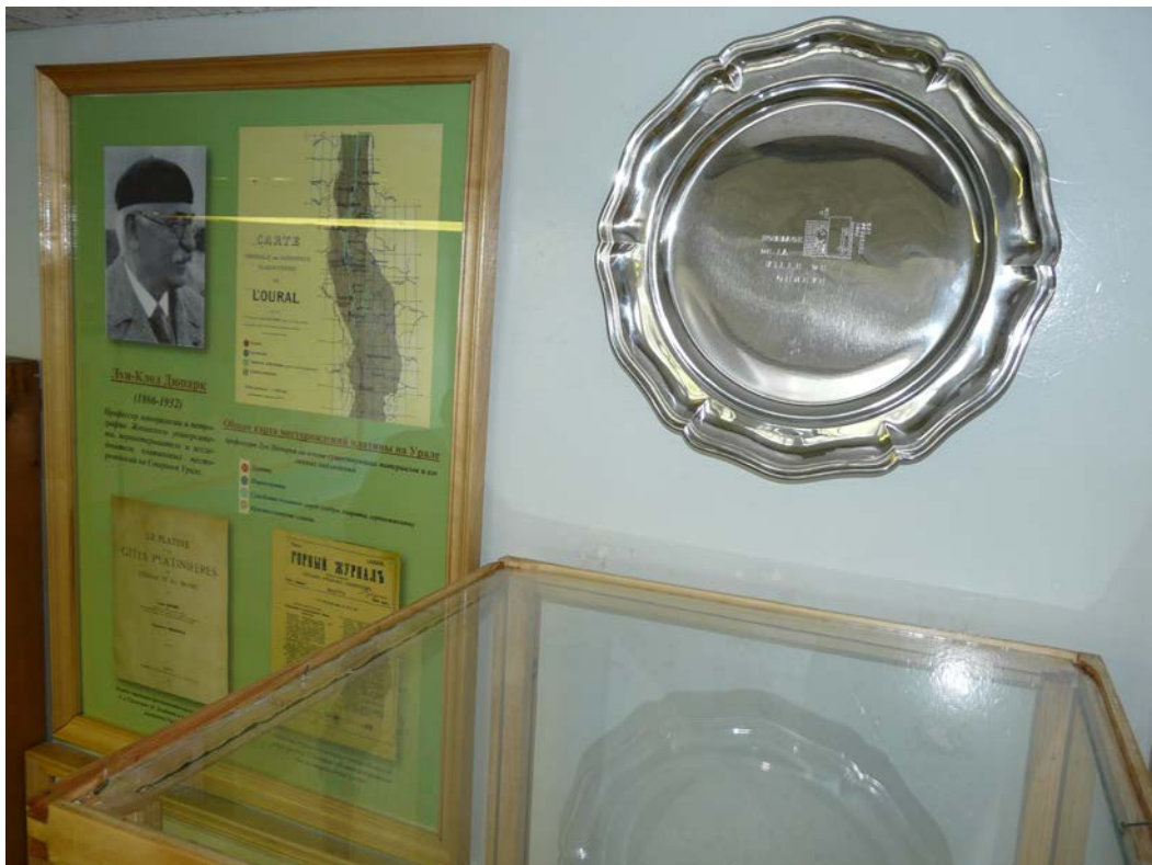
На стене: оловянное плато. Дар города Женева.