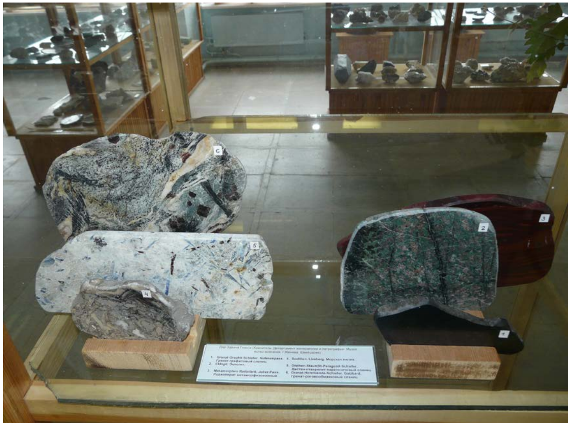
Гранат–графитовый сланец, Nufenenpass. Эклогит, Alpes. Радиоларит метаморфизованный, Julierpass. Морская лилия, Liesberg. Кианит-ставролит-парагонит сланец, Pizzo Forno. Гранат-роговообманковый сланец, Gotthard. Дар Edwin Gnos, хранителя минералогического музея (Женевский краеведческий музей).